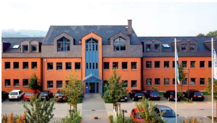
Die Bundesgeschäftsstelle der DWA in Hennef.

DWA – Diese drei Buchstaben stehen für die Erfahrung und Kompetenz ihrer Mitglieder – auf Kläranlagen, in der Planung und Produktion sowie in der Forschung und Verwaltung. Bereits seit über 50 Jahren setzt sich die DWA, wie vorher die ATV und der DVWK, für die Entwicklung einer sicheren und nachhaltigen Wasserwirtschaft ein. Als politisch und wirtschaftlich unabhängige Organisation arbeitet sie auf den Fachgebieten Wasserwirtschaft, Abwasser, Abfall und Bodenschutz.