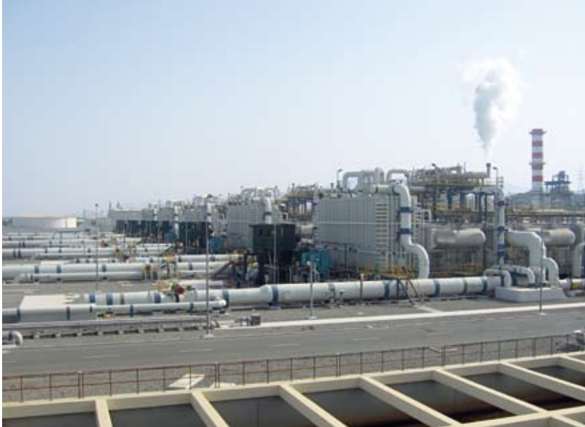
In dieser thermischen Anlage in den Vereinigten Arabischen Emiraten entsalzt man das Meerwasser durch Verdampfen.