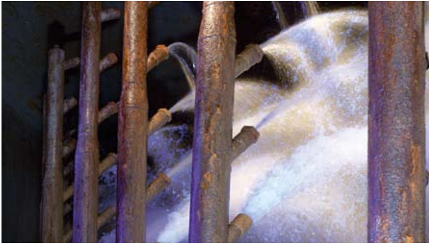
Hier wird Rohwasser über Düsen versprüht, um es mit Sauerstoff anzureichern.