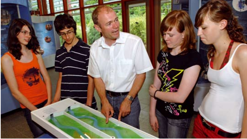
Wie Hochwasser an begradigten Flussläufen entsteht, können Schüler an der Hochwasserwippe nachvollziehen.