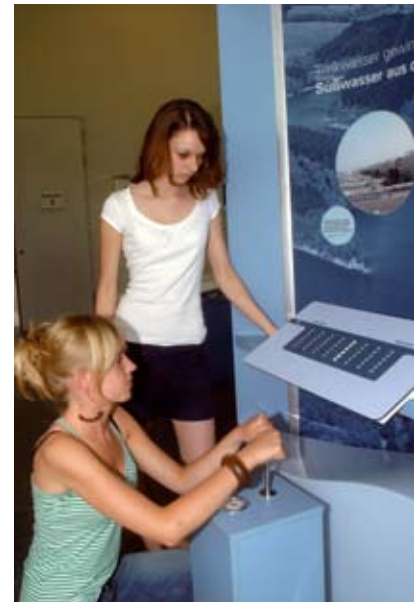
Wie aus Salzwasser Süßwasser gewonnen wird, erfahren diese beiden Mädchen. Sie müssen dafür einen hohen Druck aufbauen, in Wirklichkeit liegt dieser bei 30 bar, also zehnmal höher als im Ausstellungsmodell.

Wird Meerwasser mithilfe von Umkehrosmose entsalzt, bedeutet das: Pumpen pressen Salzwasser mit hohem Druck gegen die Membran. Wassermoleküle wandern hindurch, ein künstlicher Konzentrationsunterschied wird geschaffen: Aufkonzentriertes Salzwasser auf der einen, fast salzfreies Süßwasser auf der anderen Seite der Membran.