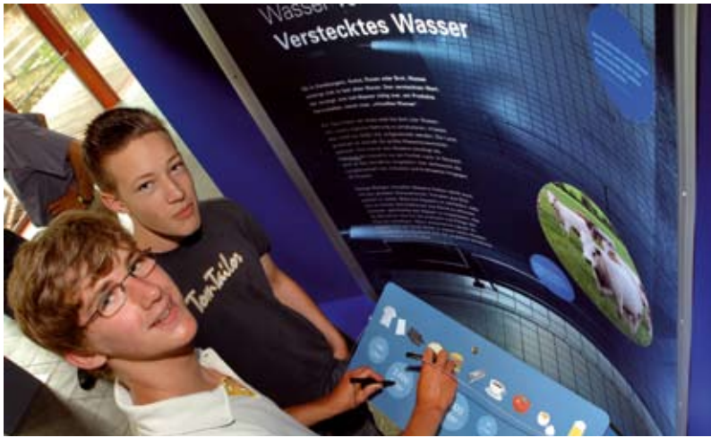
Wie viel virtuelles Wasser steckt eigentlich in einem Hamburger? Zehn Produkte laden in der Ausstellung zum Raten ein.