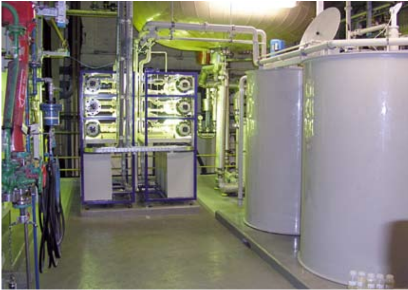
Die UV-Oxidationsanlage wandelt Antibiotika und Röntgenkontrastmittel in unschädliche Verbindungen um.