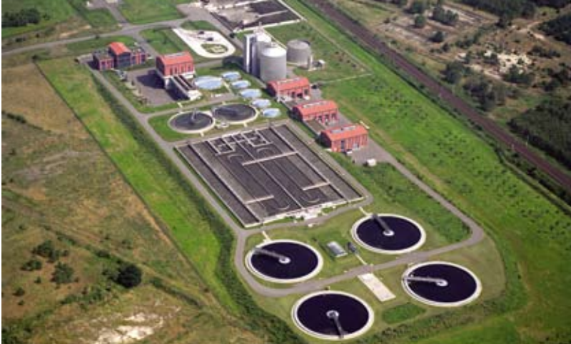
Kläranlagen reinigen das Abwasser mit mechanischen, biologischen und chemischen Methoden.