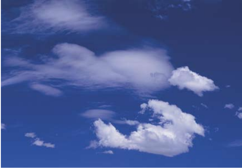
Wolken bestehen aus kondensiertem Wasserdampf.