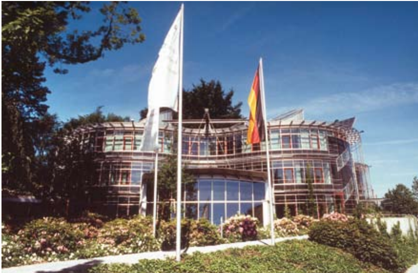
Das DBU-Verwaltungsgebäude in Osnabrück besticht durch seine eigenwillige, ökologisch orientierte Architektur.

Die Deutsche Bundesstiftung Umwelt (DBU) wurde durch Gesetz des Bundestages vom 18. Juli 1990 als Stiftung bürgerlichen Rechts gegründet. Mit dem Privatisierungserlös der Salzgitter AG in Höhe von rund 1,3 Milliarden Euro als Startkapital gehört sie zu den größten Stiftungen in Europa. Die Erträge aus dem Stiftungsvermögen stehen für Förderaufgaben zur Verfügung. Die DBU fördert innovative beispielhafte Projekte zum Umweltschutz. In den mittlerweile 18 Jahren ihres Bestehens hat sie fast 7.000 Projekte mit einer Summe von über 1,2 Milliarden Euro unterstützt.