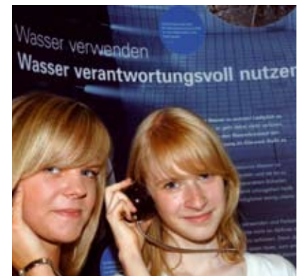
Wer kennt sich mit dem richtigen Umgang mit Wasser aus? Beim Hörspiel können Sie Ihr Wissen unter Beweis stellen – und Punkte sammeln.

In einem wasserreichen Land hat der Schutz dieser Ressource Vorrang vor dem Wassersparen. Dennoch sollten auch wir den kostbaren Rohstoff Wasser bewusst nutzen und nicht verschwenden.