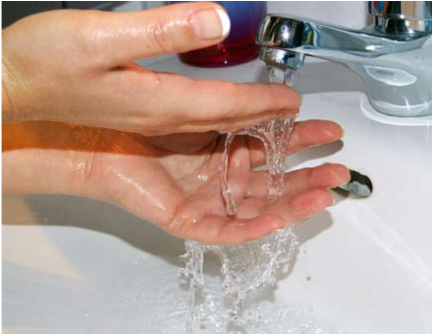
Im Haushalt wenden wir für die tägliche Körperpflege das meiste Wasser auf.

standardmäßig mit Wasser sparenden Armaturen und Toiletten-spülungen ausgestattet. Energieeffiziente Wasch- und Spülmaschinen benötigen auch immer weniger Wasser. In Europa stehen die Deutschen beim sparsamen Wasserverbrauch an zweiter Stelle – nur die Belgier sind noch sparsamer.