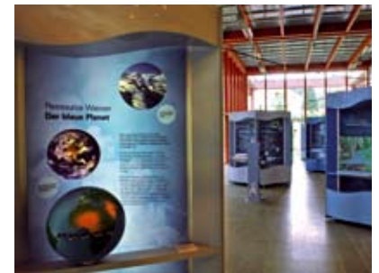
In der Ausstellung erfahren Sie in sechs Bereichen von der Ressource Wasser. Ebenso werfen Sie einen Blick in seine Zukunft.

Für diese Regionen sind Alternativen gefragt: So könnte dort durch innovative Technik mehr Abwasser zum Bewässern genutzt werden. Wassersparpotenziale liegen im nachhaltigen Feldanbau, im Anbau von Pflanzen mit geringerem Wasserbedarf und in der verbesserten Nutzung von Regenwasser.