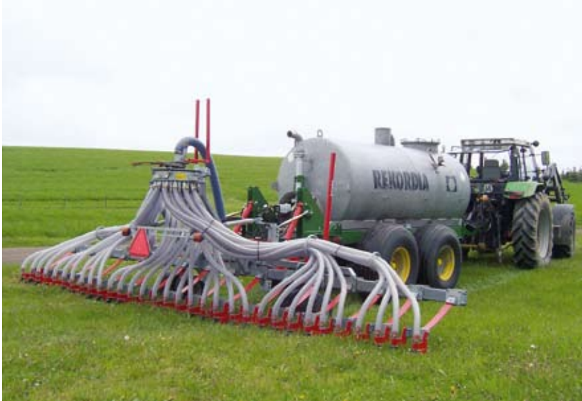
Ein bedarfsgenaues Ausbringen von Gülle trägt dazu bei, Überdüngung und Gewässerbelastung zu vermeiden.