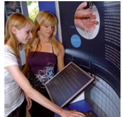
Wie viel Wasser verbrauchen wir? Am Verbrauchsrechner können Besucher Ihren durchschnittlichen Wasserverbrauch ermitteln.

Der private Verbrauch ist bei uns in den letzten Jahren sogar gesunken. Im Schnitt gut 20 Liter weniger Wasser am Tag als in den neunziger Jahren nutzt heute jeder Bundesbürger. Das sind zurzeit etwa 126 Liter. Ein Grund dafür ist, dass sich moderne Technik durchsetzte: Bäder werden beispielsweise