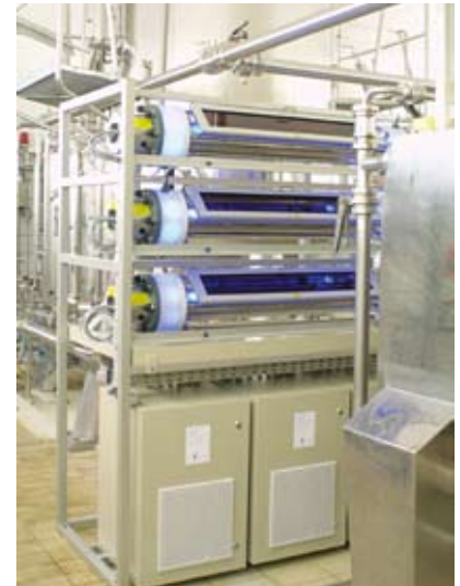
Dieser UV-Reaktor wurde speziell für die Anwendung in der Pharmaindustrie entwickelt.

Verfahren basiert auf UV-Licht. Antibiotika und Röntgenkontrastmittel können mittels UV-Oxidation bereits vor dem Einleiten in die Kanalisation in unschädliche Bestandteile zerlegt werden. Mit dieser Technologie will a.c.k. aqua concept GmbH Geräte bauen, die von Krankenhäusern und Arztpraxen eingesetzt werden können. Sie funktionieren in Miniaturform genauso wie die großtechnischen Anlagen bei den Herstellern der Pharmawirkstoffe.