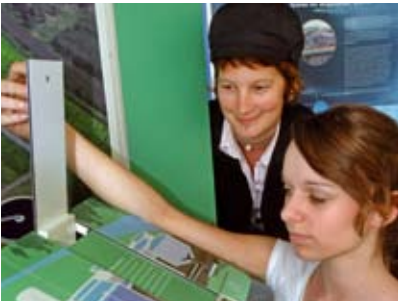
Wie funktioniert eigentlich eine Kläranlage? Das Kläppchenspiel verrät es Ihnen.

Kläranlagen reinigen das Abwasser, bevor es wieder zurück in die Natur gelangt. 95 Prozent der Bevölkerung sind in Deutschland an knapp 10.000 öffentliche Kläranlagen angeschlossen. Mithilfe von Kleinkläranlagen wird das übrige Abwasser aufbereitet. In den verschiedenen Stufen einer herkömmlichen Anlage erfolgt die Reinigung des Abwassers mit mechanischen, biologischen und chemischen Methoden.