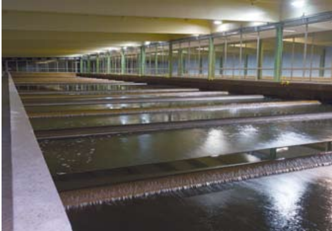
In der Schnellfilteranlage durchfließt das Wasser eine Sandschicht, die Eisen- und Manganoxide zurückhält.