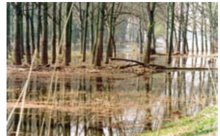
Die in der Auenlandschaft vorkommenden Lebensgemeinschaften sind auf die regelmäßige Überflutung angewiesen.

Weil ein natürlicher Schutz vor Hochwasser also weitgehend fehlt, kommen verheerende Überschwemmungen heute häufiger vor. Besonders bei begradigten Flussbetten verlagert sich Hochwasser rasch flussabwärts. Dort wo es enger wird, staut es sich dann wie in einem Trichter und tritt über die Ufer.