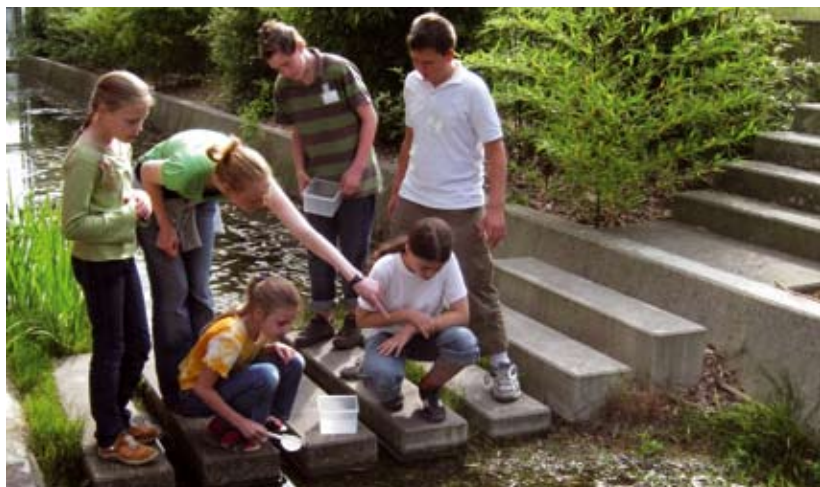
Schulklassen führen in kleinen Expertenteams Experimente zum Thema Wasser durch.