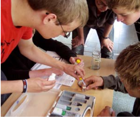
Chemische Wasseruntersuchung: Welche Qualität hat das Wasser vor dem ZUK?