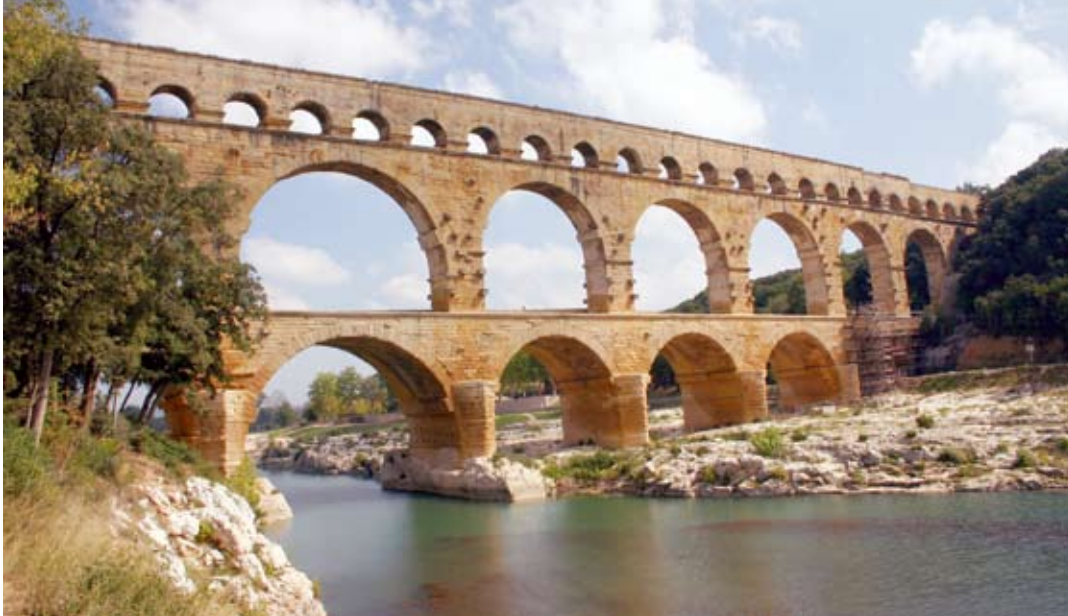
Bereits in der Antike bauten die Menschen Wasserleitungen wie die »Pont du Gard« in Südfrankreich.