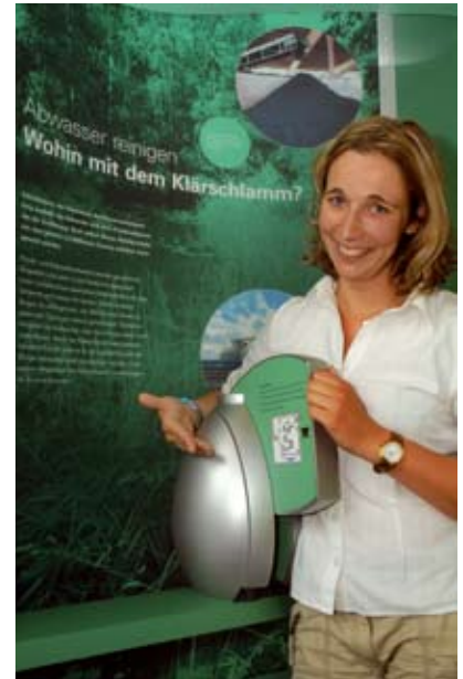
Was in einem Faulturm so alles passiert, kann der Besucher anhand dieses Modells erfahren.

Primär- und Sekundärschlamm werden gesammelt, eingedickt und dann in die Faultürme gepumpt. Unter Luftabschluss bearbeiten Methanbakterien den Schlamm und lassen ihn faulen. Dabei entsteht Biogas. Es wird genutzt, um Wärme und Strom zu gewinnen. Dem nun nahezu geruchlosen Schlamm entziehen die Klärwerker nach dem Faulprozess nochmals Wasser. Wenn der Klärschlamm weitgehend schadstofffrei ist, kann er in der Landwirtschaft als Dünger verwendet oder kompostiert werden. Eine weitere Möglichkeit den Klärschlamm zu entsorgen, ist ihn zu verbrennen.