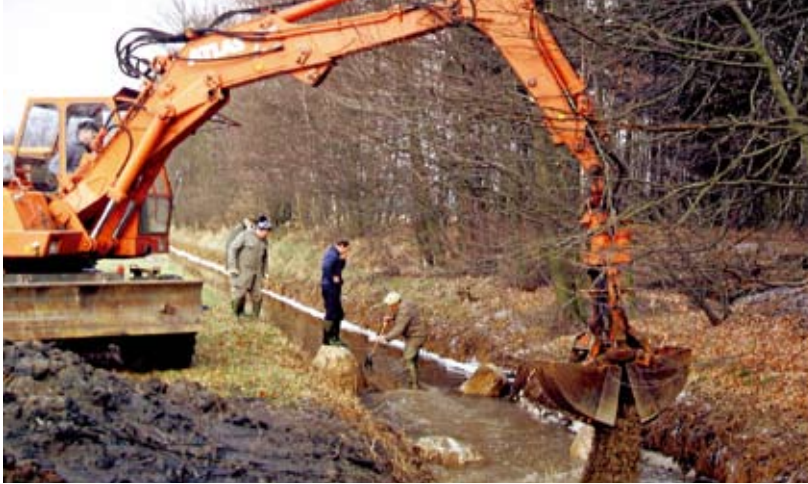
Mitglieder der Angelvereine stellen ein natürliches Kiesbett, einen Laichplatz für Forellen wieder her.