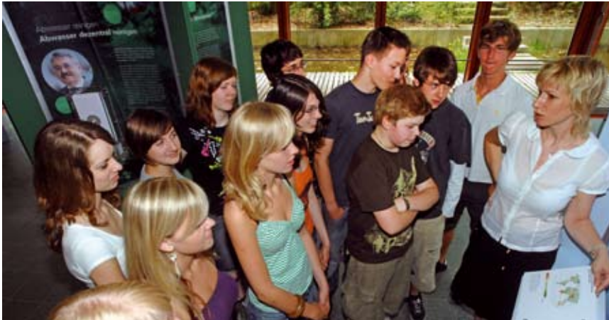
Gruppen ab zehn Personen können sich zu Führungen durch die Ausstellung anmelden.

Die »WasserWissen« ist ein gemeinsames Projekt der Deutschen Bundesstiftung Umwelt und der DWA, der Deutschen Vereinigung für Wasserwirtschaft, Abwasser und Abfall e. V. Die Wanderausstellung entwickelten die beiden Partner mit der Agentur ArchiMeDes aus Berlin.