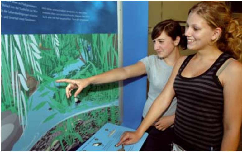
Welche Tiere leben am Flusslauf. Per Knopfdruck erfahren Sie es bei uns und lernen die Bewohner genauer kennen.