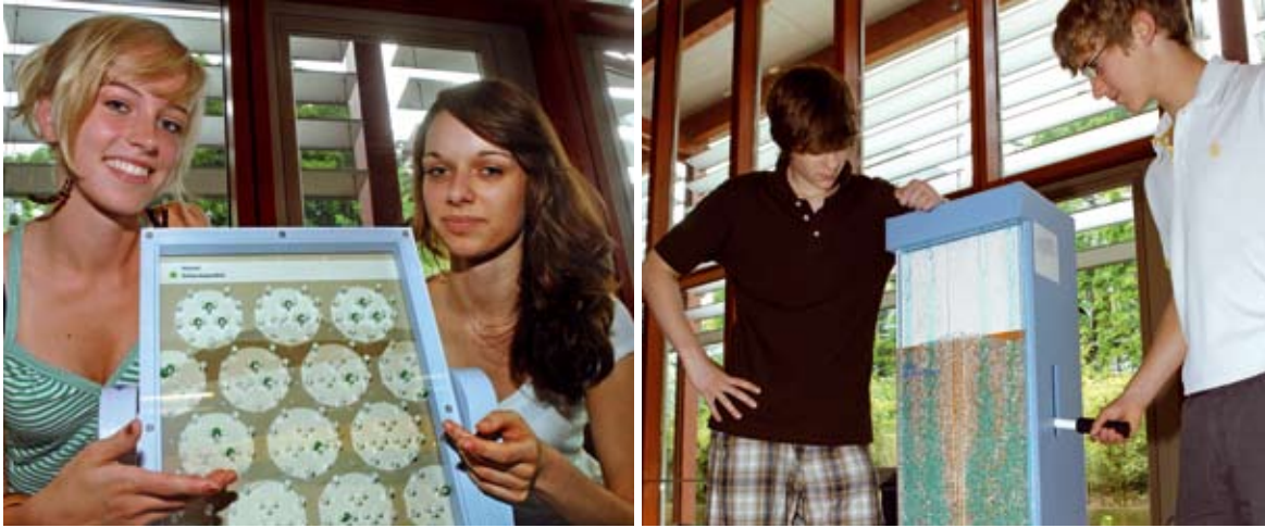
Wasser versickert durch unterschiedliche Bodenschichten. Das zeigen Sandfilter und Brunnenmodell in der Ausstellung sehr anschaulich.