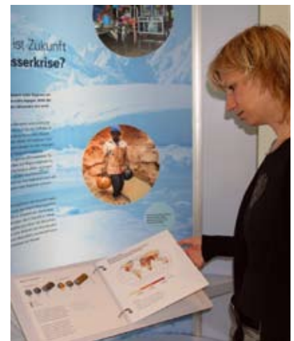
Wie viel Wasser wird im Jahr 2050 in verschiedenen Ländern der Erde noch zur Verfügung stehen. Die Karten geben einen Einblick.

Der Weltwasserentwicklungsbericht der Vereinten Nationen betrachtet Armut sowie das falsche Bewirtschaften von Wasser als wesentliche Ursachen der drohenden Krise. Als Herausforderungen, die in Zukunft zu bewältigen sind, um Wohlergehen und Leben der Menschen zu sichern, benennt er unter anderem den Grundbedarf an Wasser, das Recht auf Gesundheit und die Definition eines gemeinsamen Interesses am Wasser.