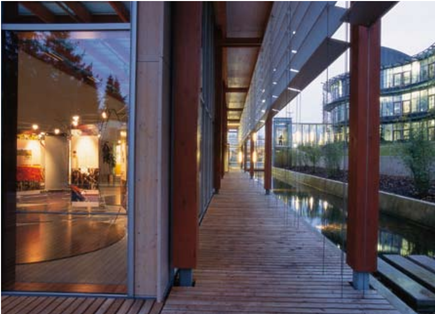
Der Neubau des Zentrums für Umweltkommunikation (ZUK) wurde nach neuesten bauökologischen Gesichtspunkten errichtet.

Vorrangige Aufgabe des Zentrum für Umweltkommunikation gGmbH (ZUK) ist es, die Ergebnisse von geförderten Vorhaben für unterschiedliche Zielgruppen aufzubereiten und in Form von Broschüren, Dokumentationen, Internet-Präsentationen, aber auch Ausstellungen und Fachveranstaltungen in die Öffentlichkeit zu tragen. 2002 wurde das neue Konferenz- und Ausstellungsgebäude des ZUK, in unmittelbarer Nachbarschaft zur DBU-Geschäftsstelle gelegen, eingeweiht. Hohe ökologische und architek-