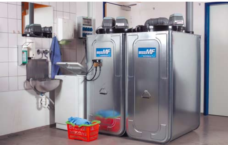
Die Hauskläranlage befindet sich in solchen geruchsdichten Behältern und kann im Keller untergebracht werden.