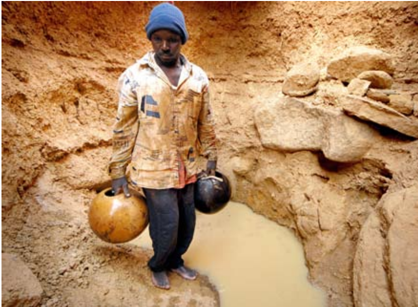
Heute schon trockene Gebiete, wie hier in Mali, werden künftig noch stärker unter Wassermangel leiden.