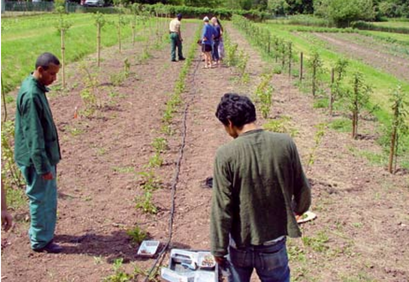
Studierende aus Deutschland und Marokko üben die wassersparende Tröpfchenbewässerung.

Bei einer weiter wachsenden Weltbevölkerung, die zunehmend in Städten ohne ausreichende Infrastruktur leben wird, entspannt sich diese Problematik keineswegs. Die Vereinten Nationen haben deshalb im Jahr 2000 das Ziel formuliert, die Anzahl der Menschen ohne Zugang zu sauberem Trinkwasser und sanitärer Grundversorgung bis zum Jahr 2015 zu halbieren.